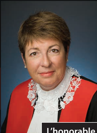
L'honorable Suzanne Hardy-Lemieux

Rendre la justice plus accessible aux personnes vulnérables